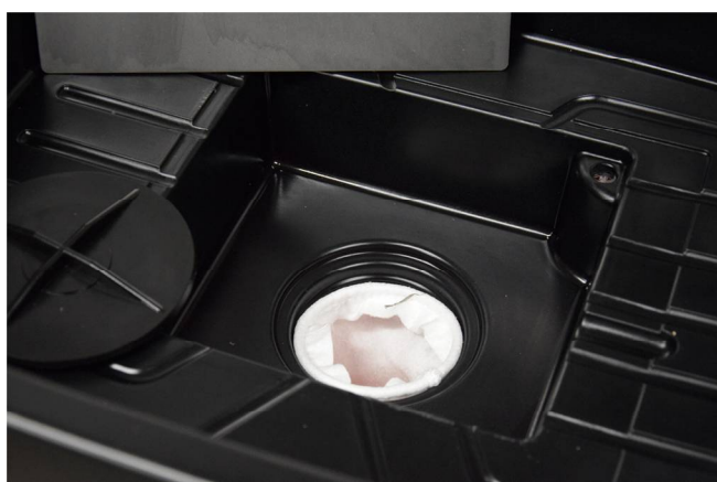
Poche filtrante, cuve de trempage, bouchon sous plaque Inox de fond.