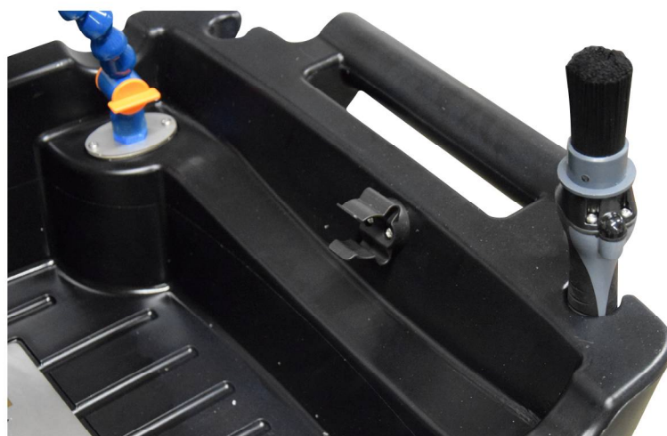
Pinceau clipsable dans le bac ou dans son logement vertical, robinet de coupure du robinet rigide articulé.